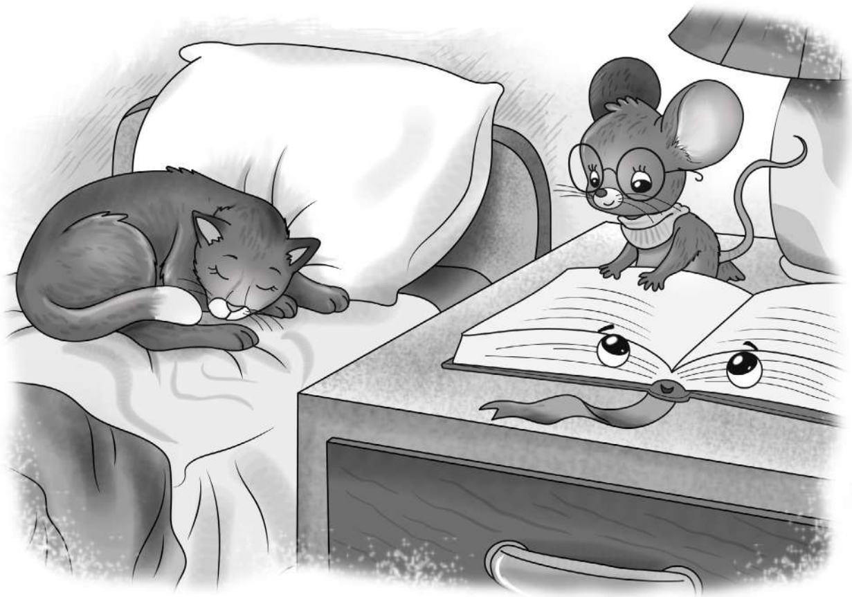
Иллюстрация Алисы Дьяченко