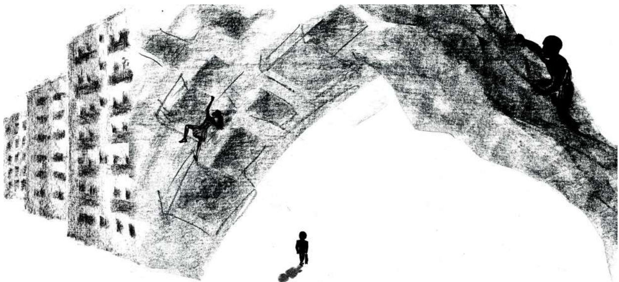
Иллюстрация Лилии Гойзман www.saatchiart.com/goyzman

Я открыл рабочий блокнот и сделал записи наблюдений. В конце добавил памятку: «Хочу назвать новый кратер именем Римана».